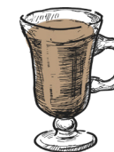
Caffè baileys kaffe, baileys coffee, baileys m