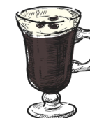
Irish coffee kaffe, jameson, krem coffee, jameson, cream m