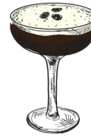
Espresso martini absolut vodka, kaffe- likør, espresso absolut vodka, coffee liqueur, espresso h