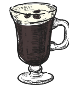
Irish coffee kaffe, jameson, krem coffee, jameson, cream m