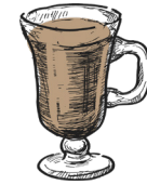
Caffè baileys kaffe, baileys coffee, baileys m