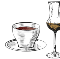
Caffè corretto espresso, amaro espresso, amaro