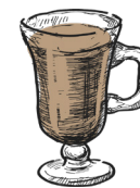
Caffè baileys kaffe, baileys coffee, baileys m