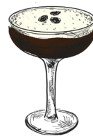
Espresso martini absolut vodka, kaffe- likør, espresso absolut vodka, coffee liqueur, espresso h