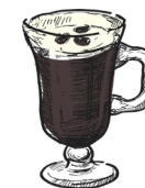
Irish coffee kaffe, jameson, krem coffee, jameson, cream m